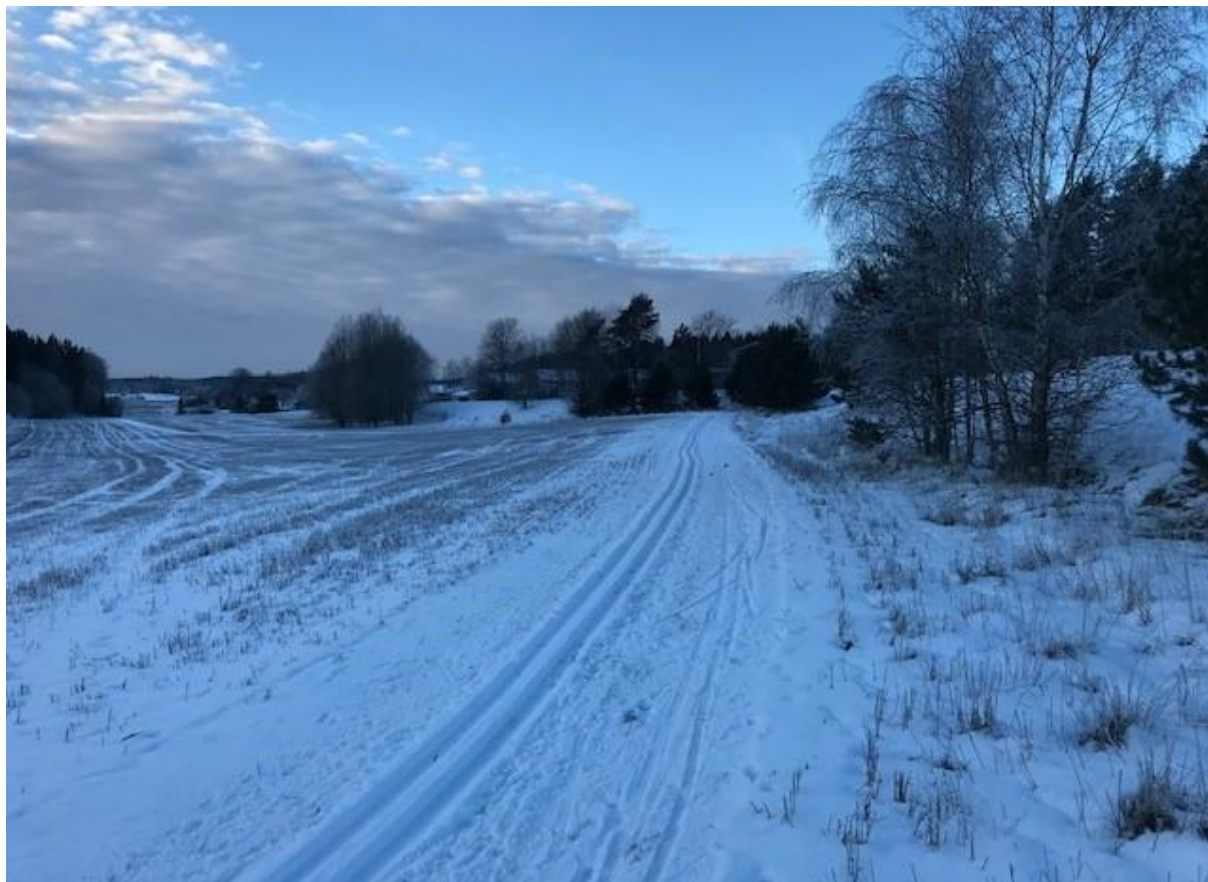
Banan måndag em

Kylan är här och vi har fina spår, därför kallar vi till skidtävling.